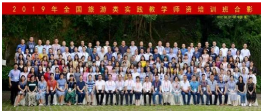
教师参加全国旅游类实践教学师资培训

(1) 长期以来，我系一直坚持大力培养双师素质教师的举措，选派教师参加国家、省、市级别的教师培训，到兄弟院校及各大型企业参观学习，不断提高教师的专业素质。