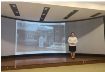
导游讲解技能考试