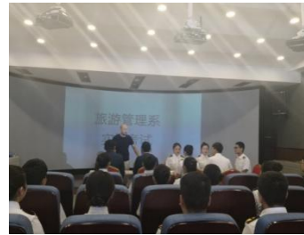
模拟导游技能考试