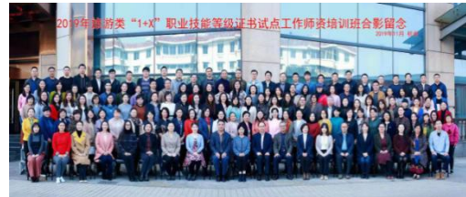
教师参加 1+x 等级证书视点师资培训