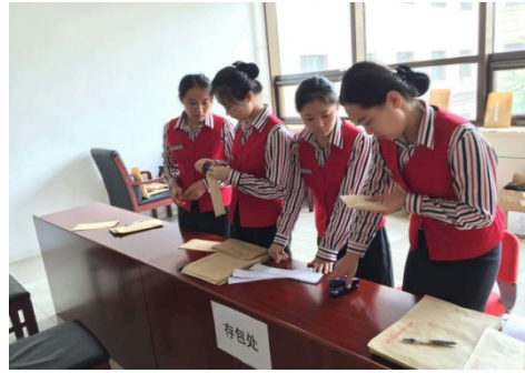
参加文化与旅游部重要会议接待工作