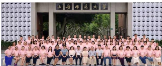
教师参加全国旅游院校酒店技能师资培训