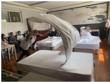
客房服务技能考试

将最新技能大赛规程视为教育评价标准，优化主要资源，从学生创造力、实践力、知识应用能力、协作互助能力、逻辑思维能力等角度出发进行教学评价，在中、西餐摆台、客房服务、模拟导游、导游讲解、礼仪和化妆等课程中引入大赛评价标准，能够根据学生学习动态进行教评指导，发挥以赛促教优势，有效提升教师职业能力及教学质量。