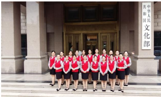
北京文化与旅游部会议服务中心实习

(2) 加强校内和校外实训基地建设，新建北京文化与旅游部会议服务中心、北京诺金酒店、北京北辰洲际等校外实训基地 6 个，积极探索与企业的合作，通过更真实的企业环境为学生提供更真实的岗位锻炼机会，引入企业技能和生产管理文化，从而实现职业院校技能教学与企业实际技能水平的对接。