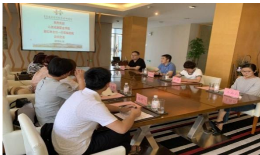
青岛酒店管理学院对标交流学习