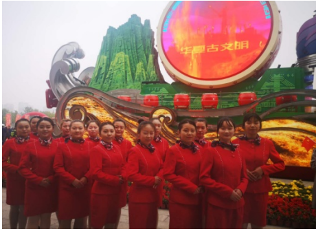
参加国庆彩车巡展启动仪式礼仪服务