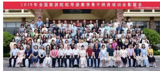
教师参加全国旅游院校导游师资培训