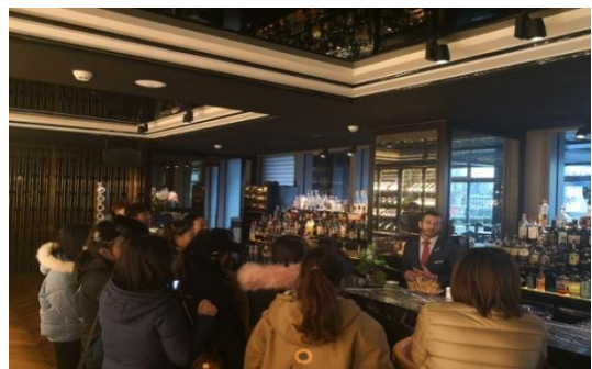
北京诺金酒店实训