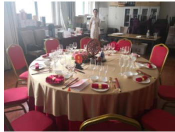
中餐摆台技能考试