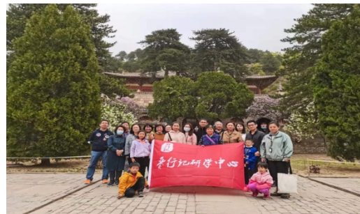
教师导游专业研学培训学习