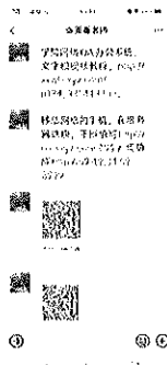
图 1. 学院 OA 办公系统视频教程及移动客户端下载地址