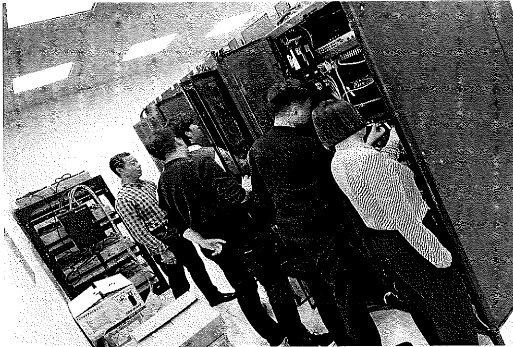
图 1.工作人员在中心机房进行培训