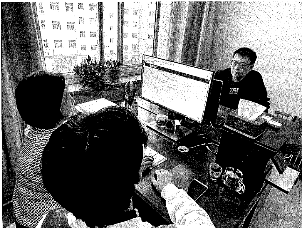
图 2.工作人员在后台管理系统进行培训