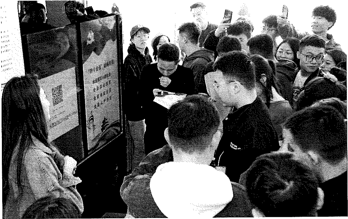
图 3.工作人员对学生进行电子图书培训